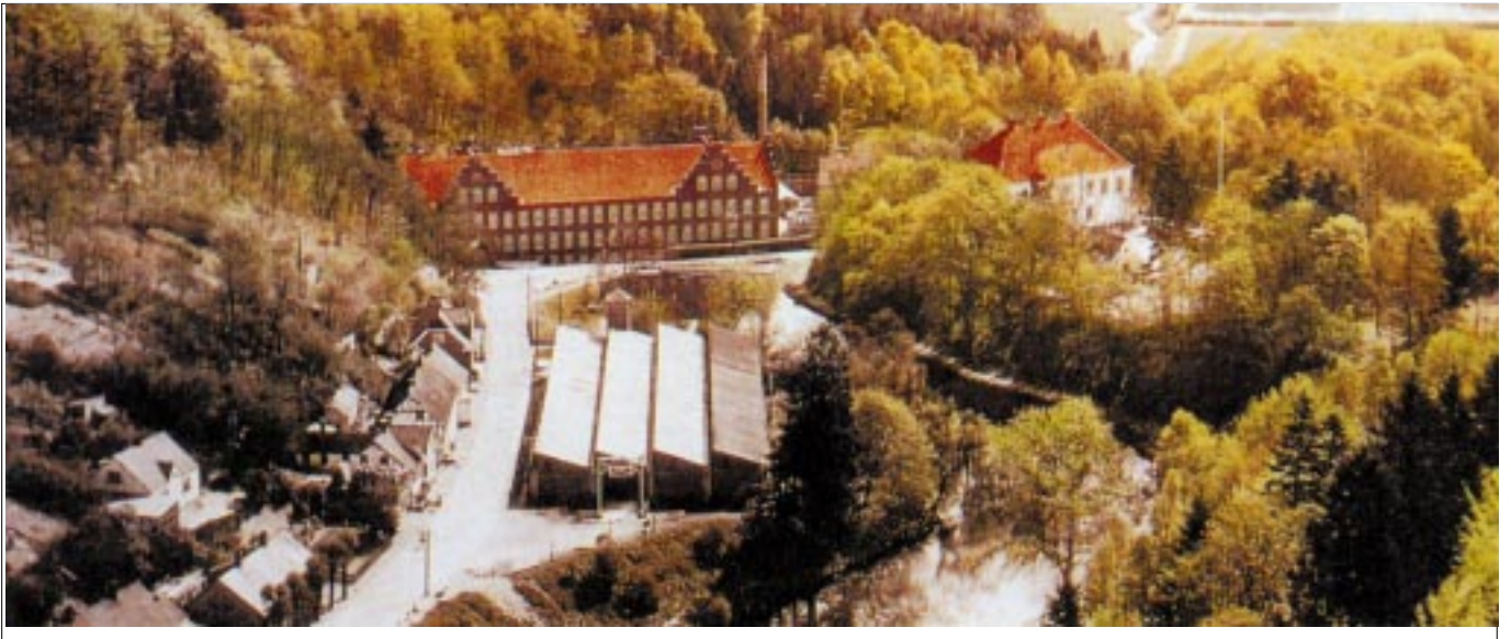
Randbøldal Fabrik med den opstemmede å

1600-tallets stampemøller til valkning af klæde bliver starten på de følgende århundredes storindustri langs Vejle Å. Gamle kornmøller bliver ombygget til papir- og stampemøller og nye industrimøller anlægges, hvor åens fald er størst.