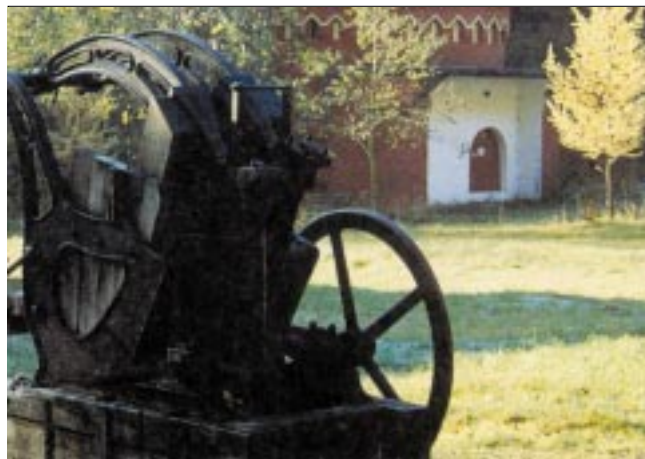
Den sidste originale klædestampe fra Randbøldal Fabrik. Stammerne eller hamrene fildede tøjet, og gav det dermed større slidstyrke

De tidligste møller ved Gødding og Vingsted var store kornmøller anlagt på hovedløbet, hvor Hærvejsstrøget og de større vadesteder krydsede Vejle Å. Det var kongen og måske klostrene, der var middelalderens møllebyggere. Møllerne var nemlig et økonomisk aktiv for kongemagten, da bønderne var tvunget til, at lade deres korn male her.