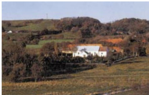
Landsbyen Skibet ligger midt i ådalen på en terrasse hævet lidt over dalbunden

Jernalderen har sat sig flere spor i ådalen. På bunden af Vingsted Sø ligger sønderdelte våben og personlige ejendele fra en flok jernalderkrigere. Ofret mellem 200-300 e.kr. Fra samme tid rejser tilflugtsborgen Troldborg Ring sig omkranset af volde og grøft. Strategisk placeret på kanten af ådalen ved det gamle vadested, hvor Harald Blåtand langt senere, i 980, slår bro over den brede ådal i Ravnings enge.