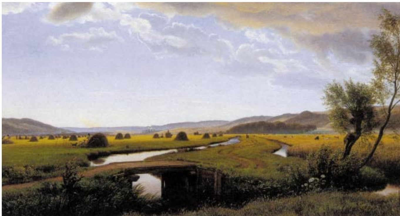
P. C. Skovgaard: Den store Eng ved Vejle. 1867