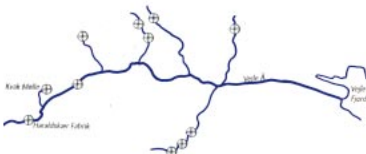
Møllerne langs Vejle Å og dens sideløb