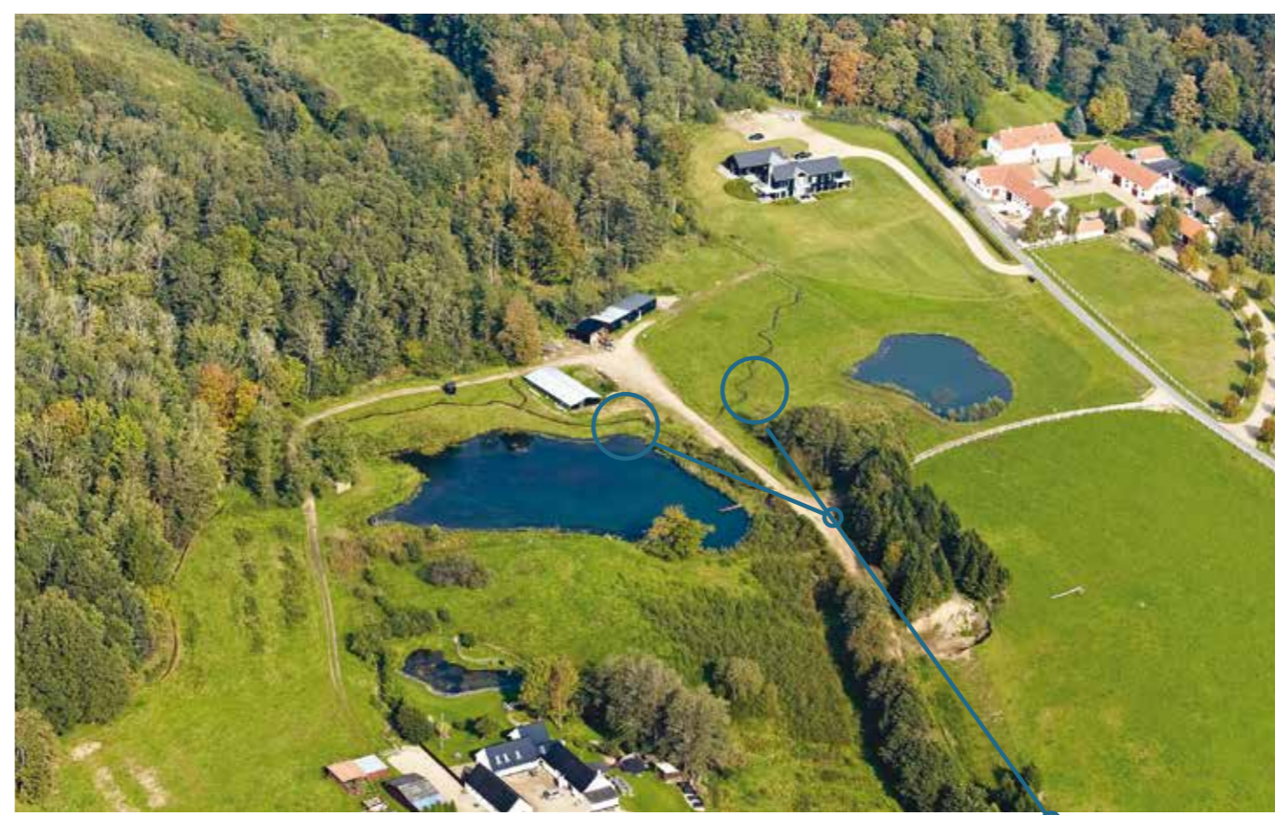
Hvor Sælde dambrug lå før, ligger nu to smukke søer. På billedet er også to nye vandløb. På billederne til højre ses det tidligere dambrug fra før 2007.