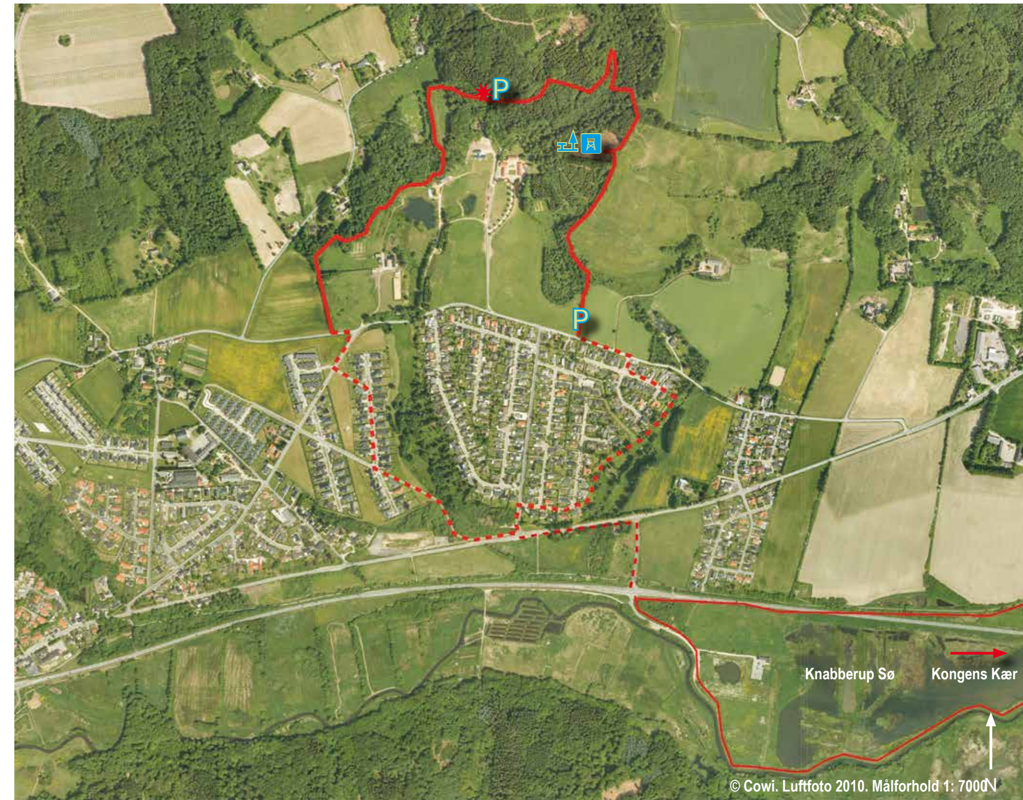
Luftfoto 2010. Målforhold 1: 7000N

Naturprojektet ved Østengård har i alt kostet ca. 2 mill. Kr.