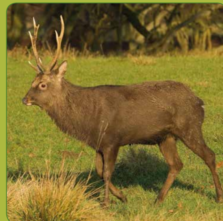
① Sikavildt han/hjort - forgrenet gevir

Råvildtet er den mindste og mest almindelige hjortevildtart i Danmark, ca. 600.000 stk. De findes overalt i landet og lever i løv- og nåleskove, hvor der er små buske, de kan gemme sig mellem.