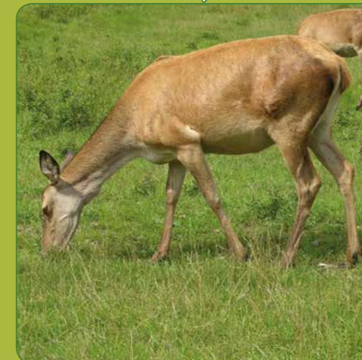
③ Kronvildt hun/hind