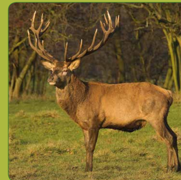
③ Kronvildt han/hjort