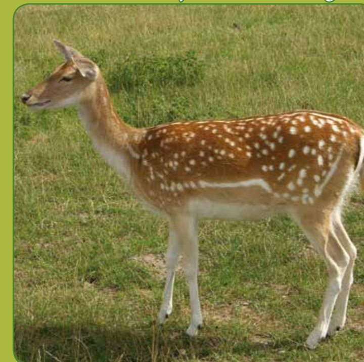
② Dåvildt hun/då - smuk rødbrun