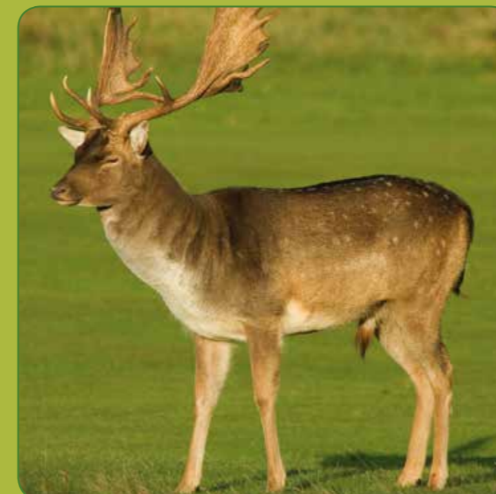
② Dåvildt han/hjort-skovlformet gevir