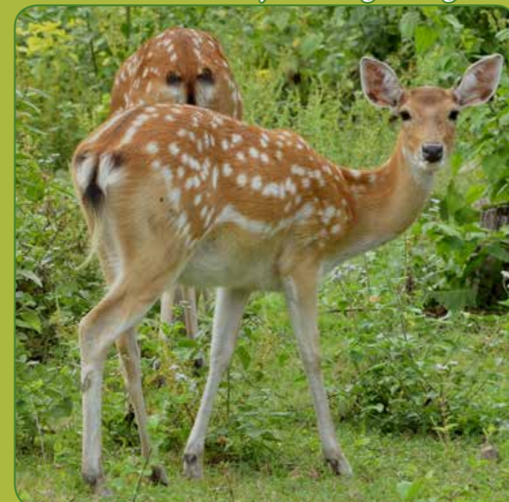
① Sikavildt hun/hind