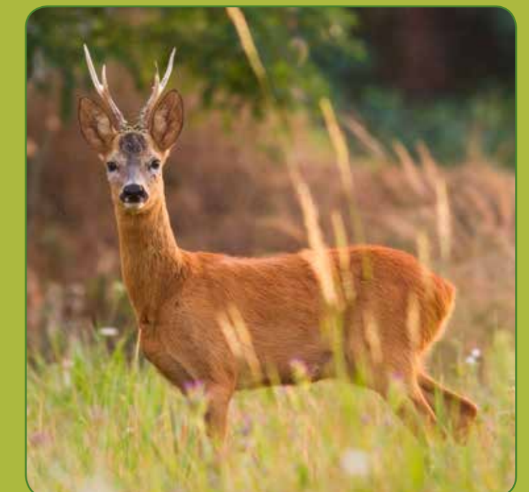
④ Råvildt han/buk