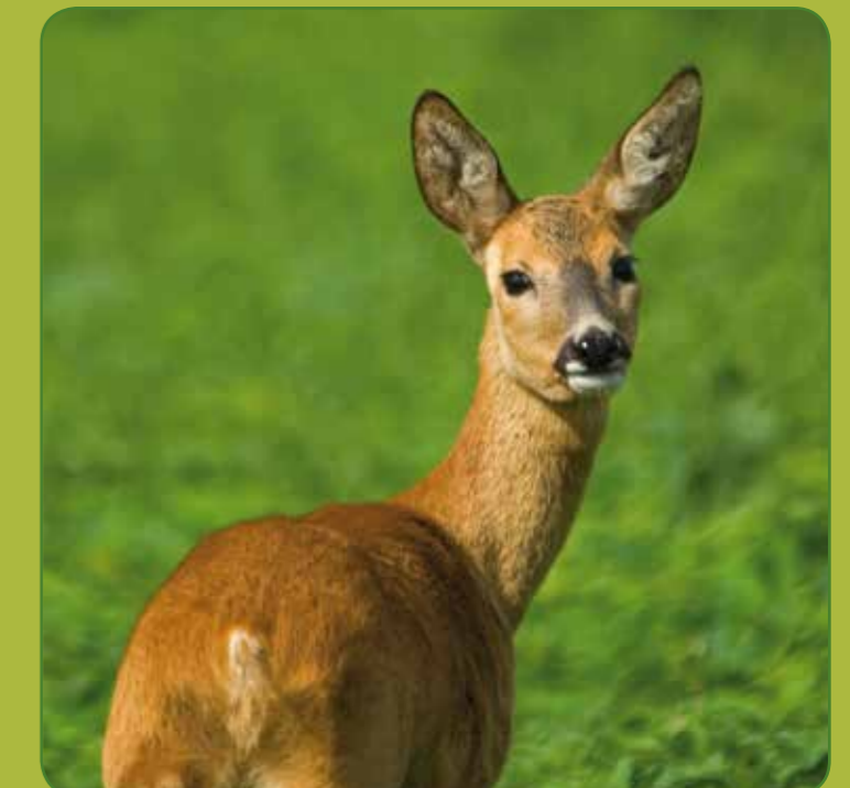
④ Råvildt hun/rå