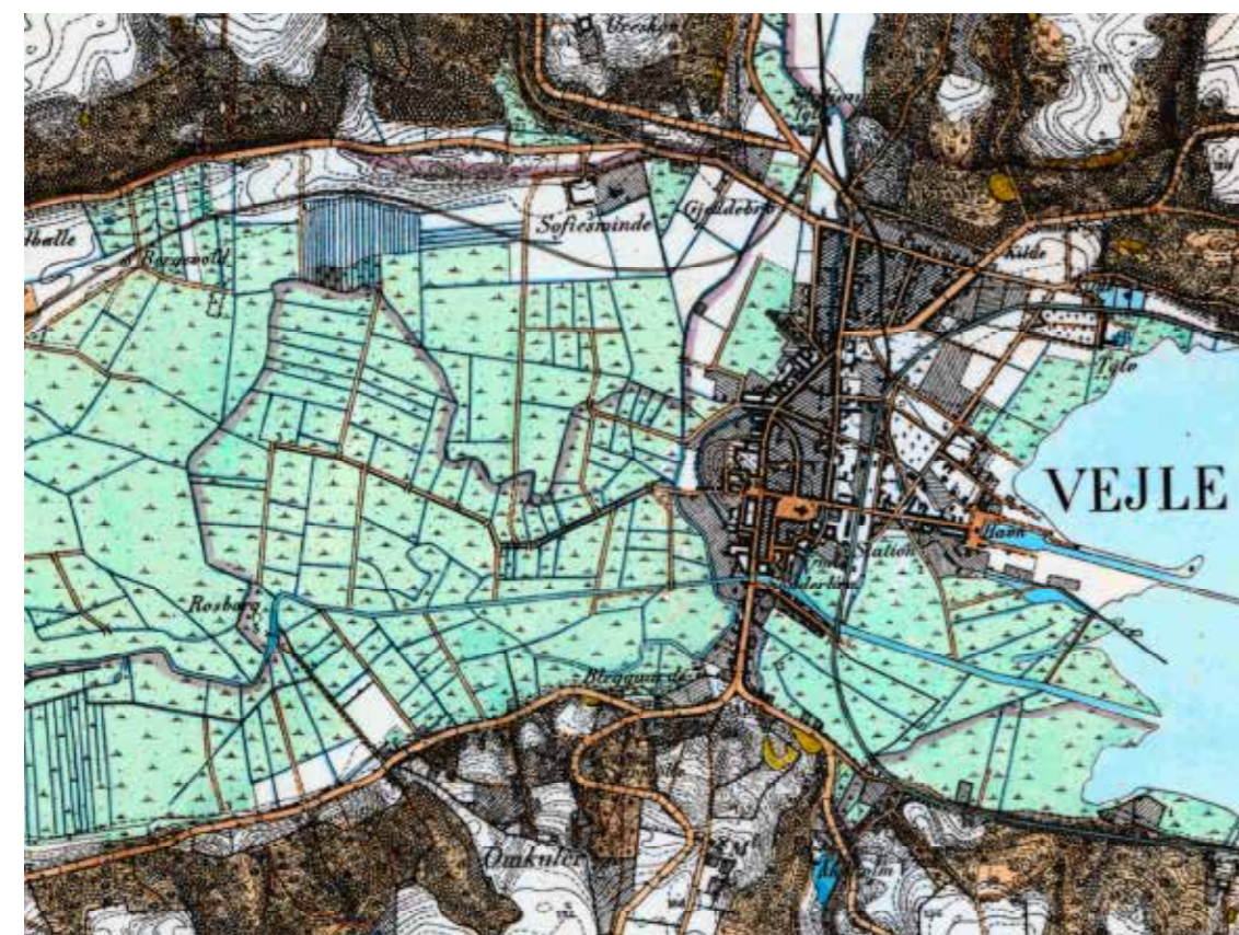
Vejle Ådal i sidste halvdel af 1800-tallet. Blød og fugtig jordbund er grunden til, at der ikke er nogen særlig udbygning af Vejle by før begyndelsen 1900 tallet.