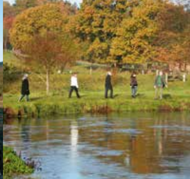
Efterår ved Vejle Å