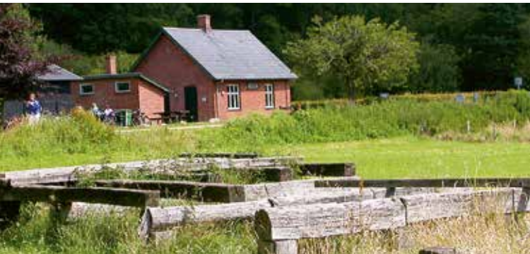
Ravning Station og en 1:1 rekonstruktion af vikingebroen