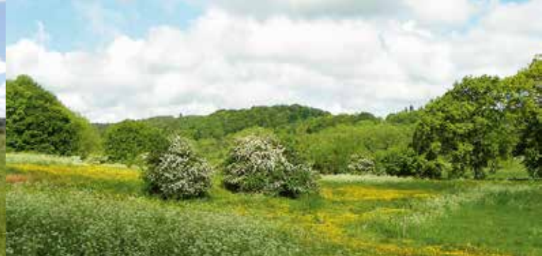
Vejle Ådal i fuld forårsdragt neden for Ødsted Skov vest for Vingsted