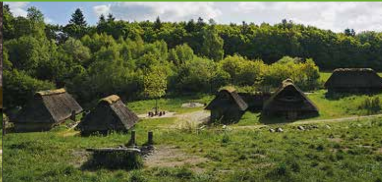
Jernalderlandsbyen i Vingsted med huse og gårde fra perioden omkring Kristi Fødsel

hulvejene ender begynder det 760 meter lange broanlæg - Ravningbroen, som Harald Blåtand i 979/80 lod opføre tværs over Ådalen.