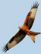
Rød Glente kan ses i ådalen.