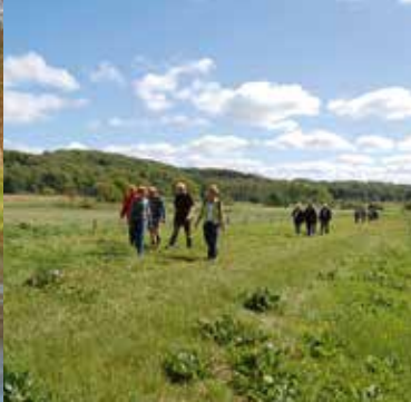
På vandring langs Ravningbroens forløb