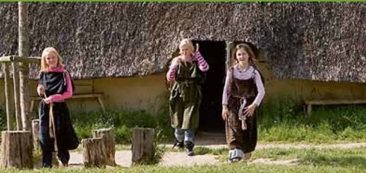
Skoleklasser kommer på lejrskole i jernaldermiljøet ved Vingsted